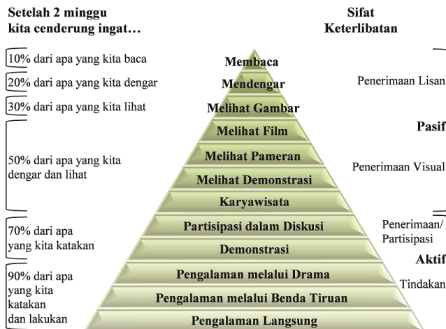
Gambar 9. Cone of Experience (Dale, 1946)

mahasiswa dapat melalui proses perbuatan atau mengalami sendiri apa yang dipelajari, proses mengamati dan mendengarkan melalui media tertentu dan proses mendengarkan melalui bahasa (Dale, 1946). Semakin konkret mahasiswa mempelajari bahan pelajaran, maka semakin banyak pengalaman yang diperolehnya. Pada pembelajaran menggunakan multimedia interaktif, mahasiswa bisa melihat proses, mendengarkan dan melihat video tutorial, mengamati proses penyelesaian suatu soal, bahkan berpengalaman langsung dalam menyelesaikan suatu soal.